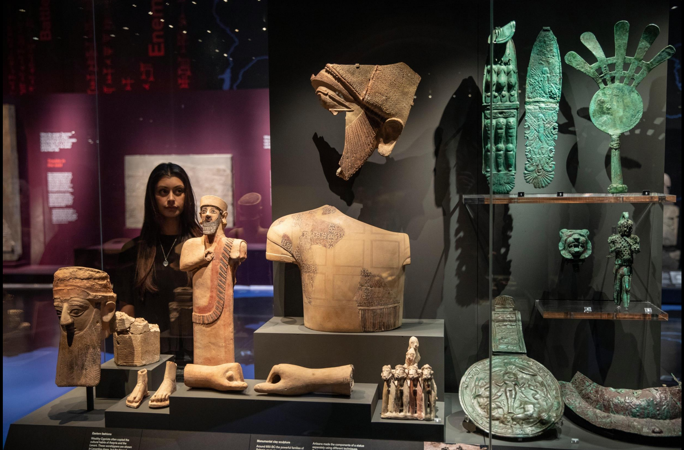
Artisans made the components of a statue separately using different techniques. Body parts were often dressed